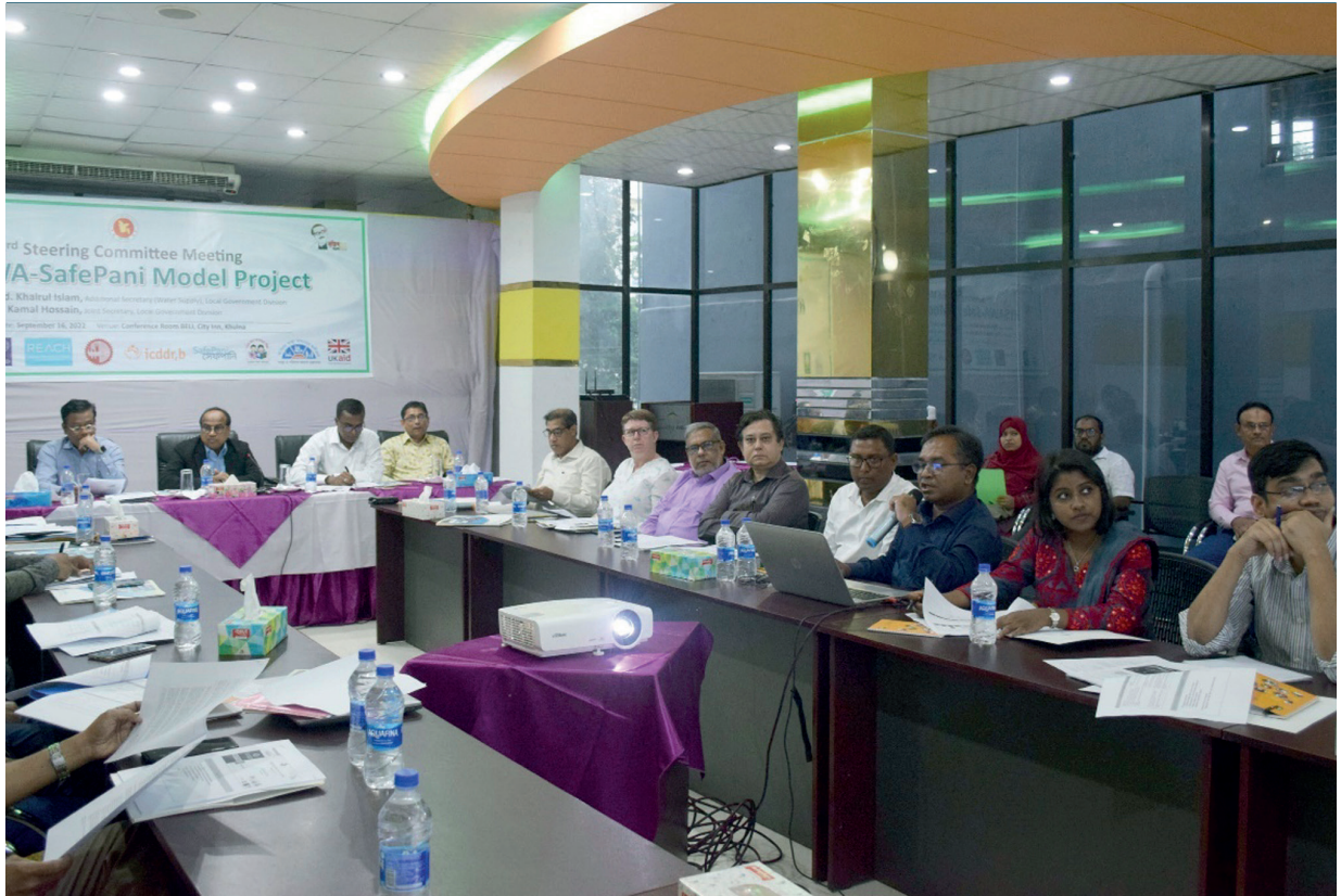
চিত্র ৩: ২০২২ সালের সেপ্টেম্বরে খুলনায় তৃতীয় জাতীয় পরিচালনা তথা স্টিয়ারিং কমিটির সভা।

গ. একটি তথ্য সংরক্ষণ প্ল্যাটফর্মের গঠন এবং তার রক্ষণাবেক্ষণ করা যা পানি সরবরাহ পরিষেবার ক্ষেত্রে পানীয় জলের মান, পরিষেবার নির্ভরযোগ্যতা, পরিষেবার আয়তন এবং পরিষেবার খরচ সম্পর্কিত কর্মক্ষমতা পরিমাপের উপর আলোকপাত করে।