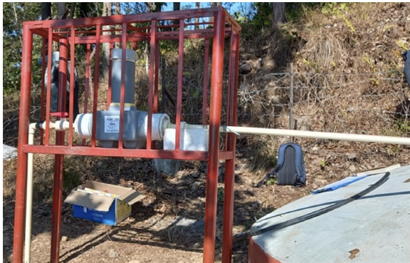
চিত্র ৬: পিওর অল ১০০ নামক যন্ত্র কর্নালি প্রদেশে পাইপ সরবরাহের জন্য ইন-লাইন ক্লোরিনেশন প্রদান করছে।

রিচ সহযোগীরা বর্তমানে সাসওয়া -কে প্যাসিভ ক্লোরিনেটর বসানোর পরামর্শ দিচ্ছেন (চিত্র ৬) যার মধ্যে রয়েছে কার্যকর পর্যবেক্ষণ এবং যন্ত্রপাতি নিয়ন্ত্রণের নির্দেশিকা। এই সংযোগের ফলে স্থানীয় ক্লোরিনেশন বিক্রেতাদের ব্যবসা বেড়েছে এবং ভবিষ্যতে ক্লোরিনেশন পদ্ধতির উৎকর্ষ সাধনে গবেষণার সুযোগ সৃষ্টির আলোচনা শুরু হয়েছে। নেপালে রিচ এর এই পানি নিরাপত্তা পদ্ধতি পুনরাবৃত্তির উদাহরণই প্রমাণ করে বিচ্ছিন্ন গ্রামীণ জনপদের জন্য প্রদর্শিত পানি নিরাপত্তা ব্যবস্থার ক্রমবর্ধমান চাহিদা।